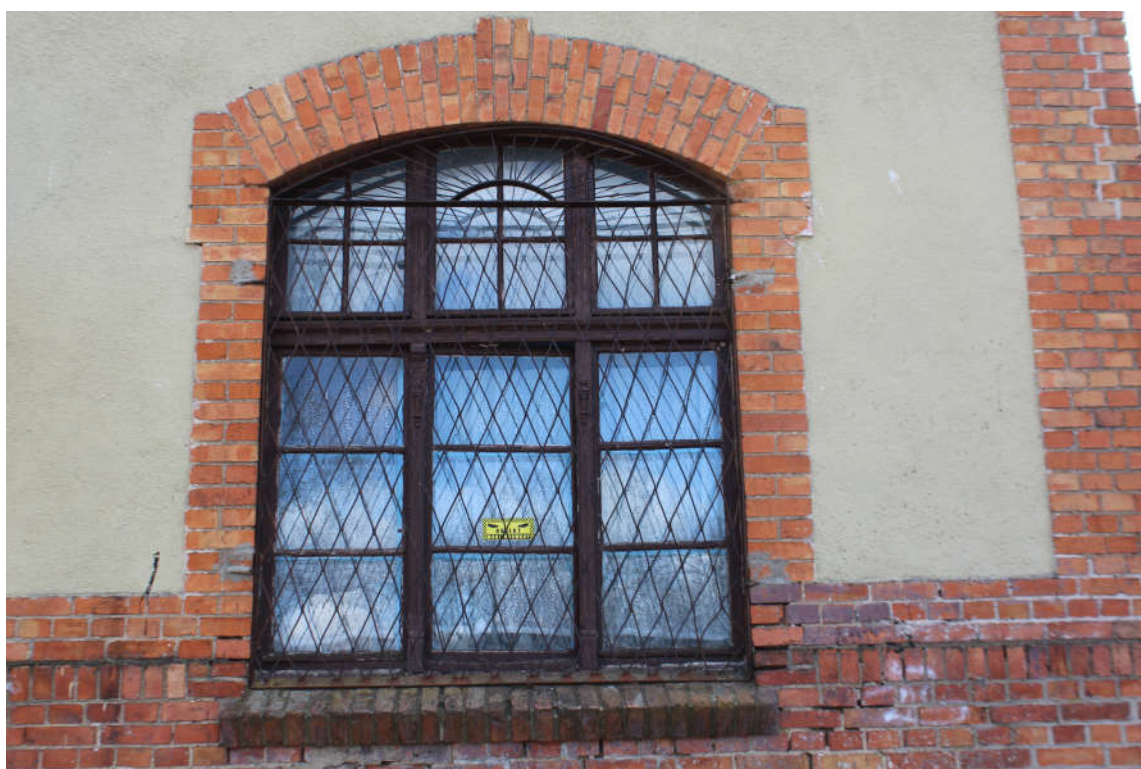
Okno nr 6 widok od zewnątrz.