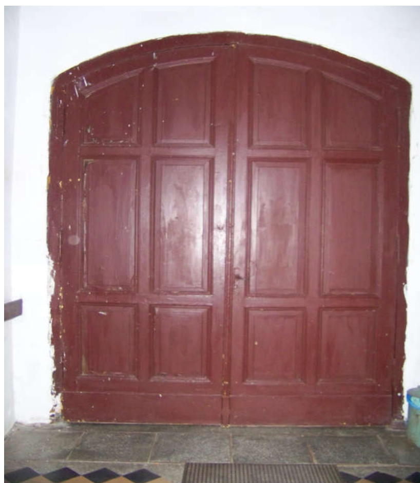
Drzwi D1 widok od wewnątrz 2