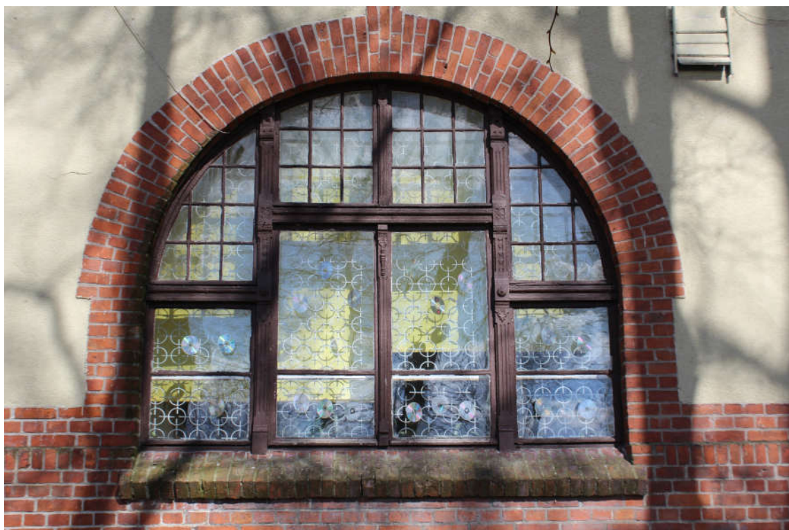
Okno nr 3 widok od zewnątrz.