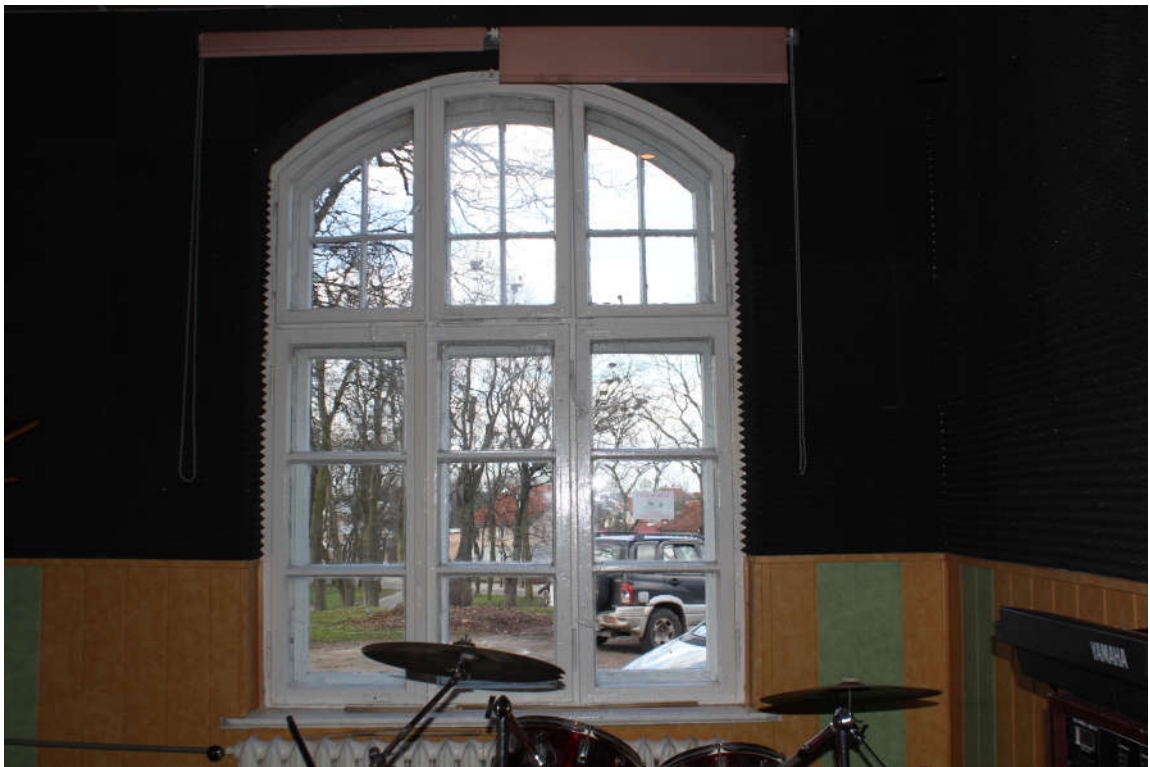
Okno nr 4 widok od wewnątrz