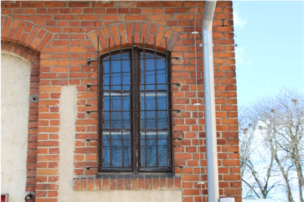
Okno nr 10 widok od zewnątrz