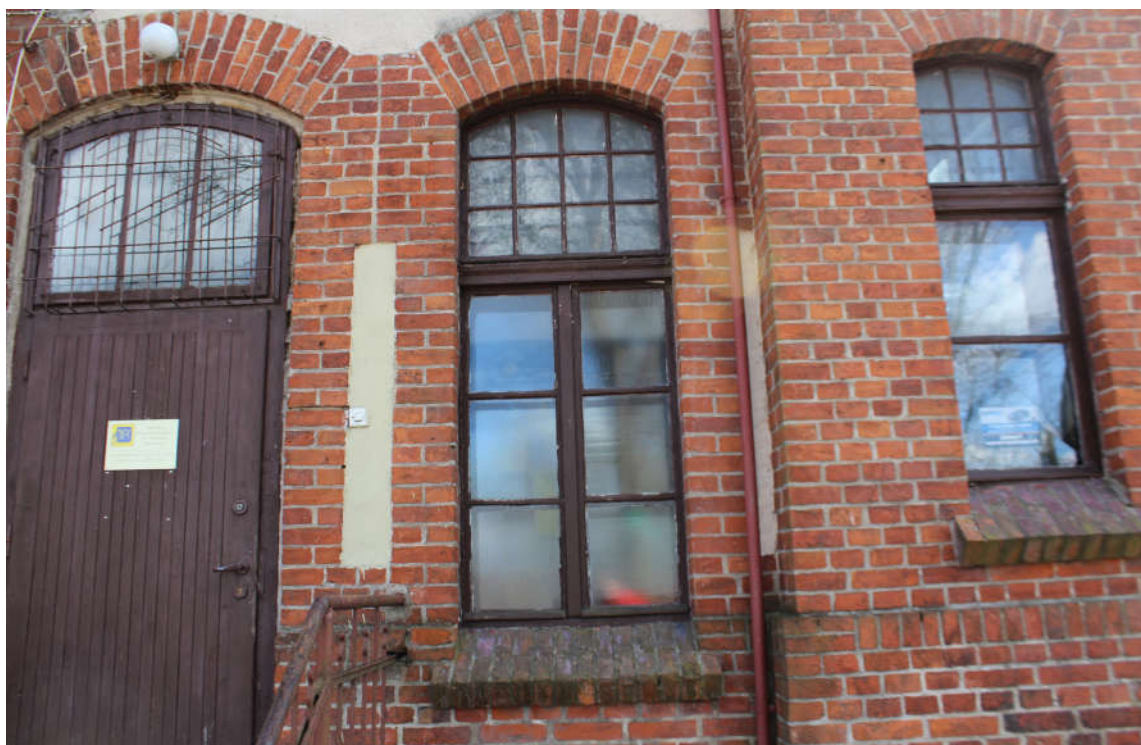
Okno nr 7 widok od zewnątrz.