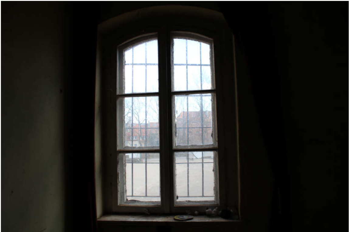
Okno nr 10 widok od wewnątrz.