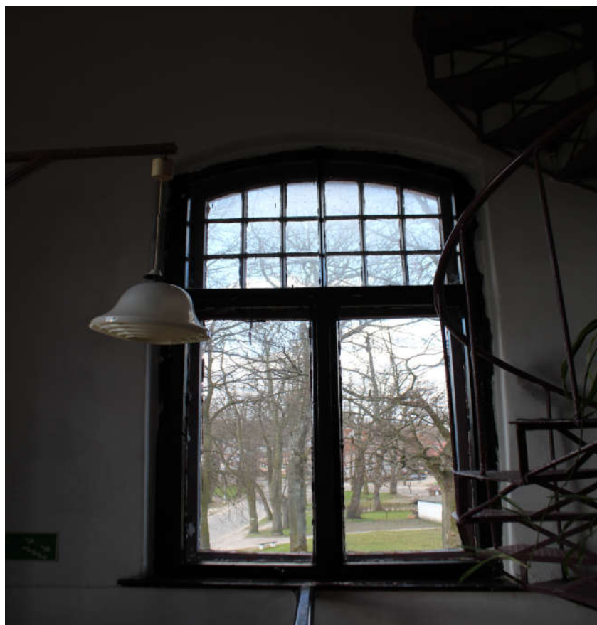
Okno nr 1 widok od wewnątrz