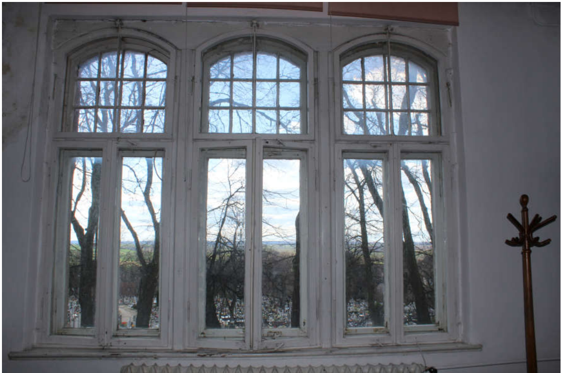
Okno nr 2 widok od wewnątrz.