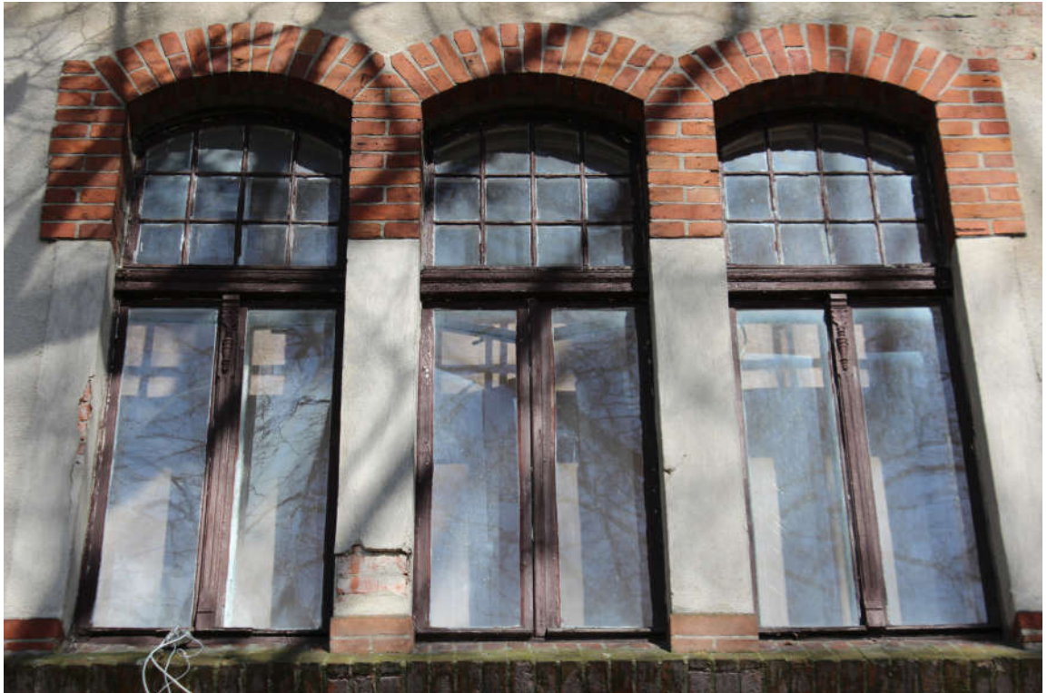
Okno nr 2 widok od zewnątrz.