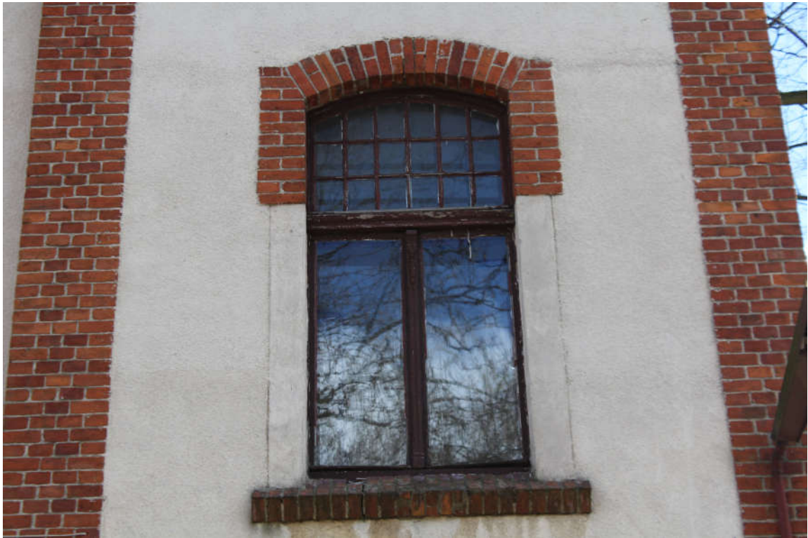
Okno nr 1 widok od zewnątrz