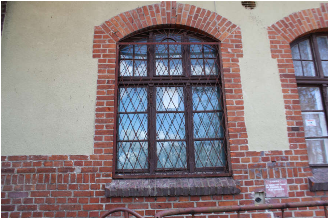
Okno nr 4 widok od zewnątrz