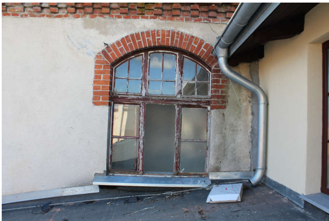
Okno nr 8 widok od zewnątrz.