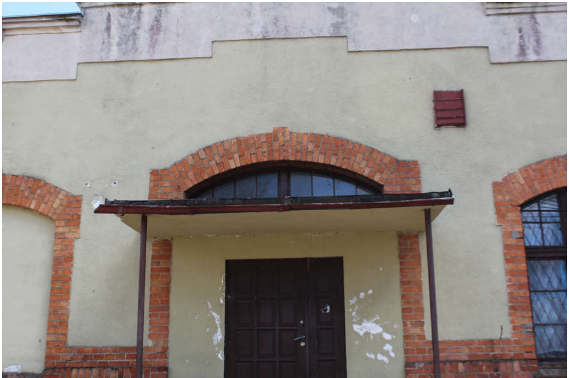
Drzwi D3 (naświetle nad drzwiami) widok od zewnątrz