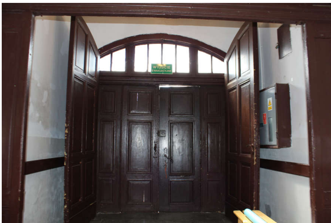
Drzwi D1 widok od wewnątrz