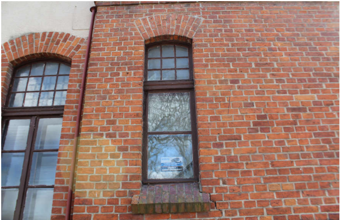
Okno nr 5 widok od zewnątrz.