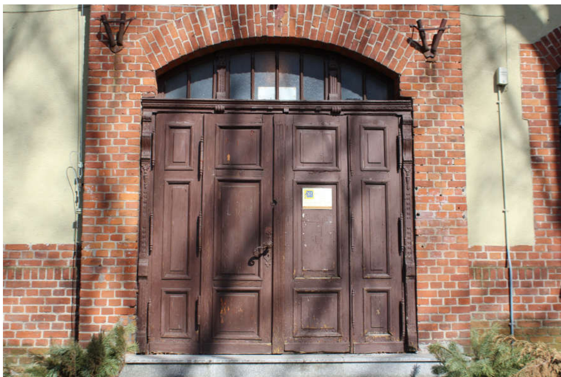
Drzwi D1 widok od zewnątrz