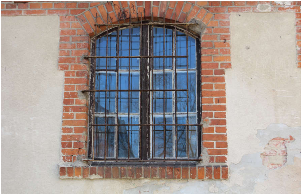
Okno nr 9 widok od zewnątrz