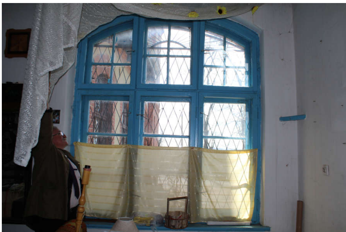
Okno nr 6 widok od wewnątrz.